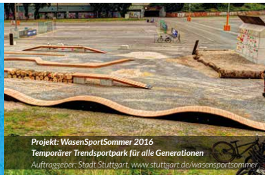
Projekt: WasenSportSommer 2016 Temporärer Trendsportpark für alle Generationen Auftraggeber: Stadt Stuttgart, www.stuttgart.de/wasensportsommer

Modulare BLOACS®-Elemente für maßgeschneiderte Bewegungslandschaften und Events.